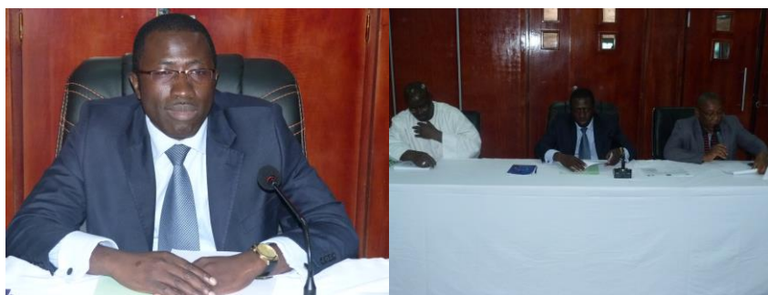
Photos 7 et 8 : Vue d'ensemble du présidium lors de la cérémonie de clôture

La cérémonie de clôture a été présidée par le Pr OTTA BOUNA, représentant le Ministre de l'Intégration Africaine et des Ivoiriens de l'Extérieur de la République de Côte d'Ivoire en accompagnant le Coordonnateur PRA-marchés représentant le Secrétaire Exécutif du CILSS. Elle a été marquée (i) la lecture des relevés de conclusion (recommandations), (ii) trois motions de remerciements à l'endroit respectifs de Son Excellence Alassane Dramane Ouattara, Président de la République de Côte d'Ivoire, au Ministre de l'Intégration Africaine et des Ivoiriens de l'Extérieur et enfin aux partenaires techniques et financiers en particulier l'UE et (iii) un mot du Coordonnateur PRA-Marchés et enfin (v) le Discours de clôture (annexe 3c).