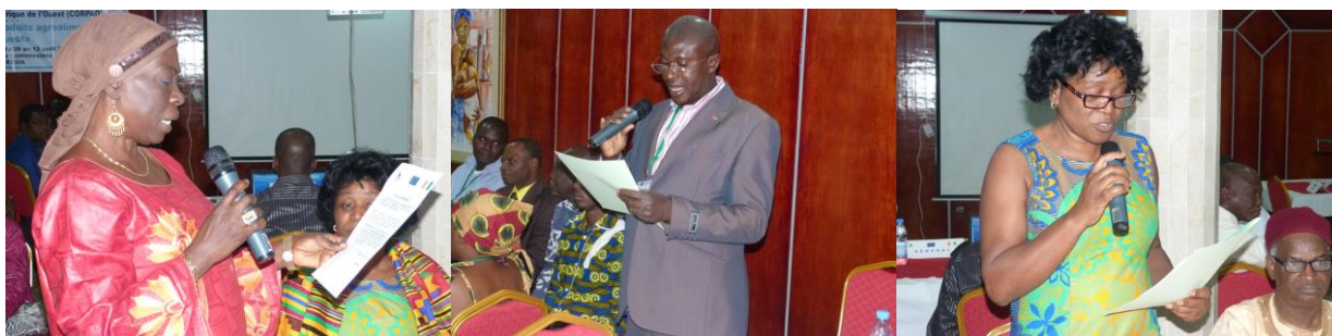
Photos 9, 10 et 11 : Lecture des motions de remerciements par les participants