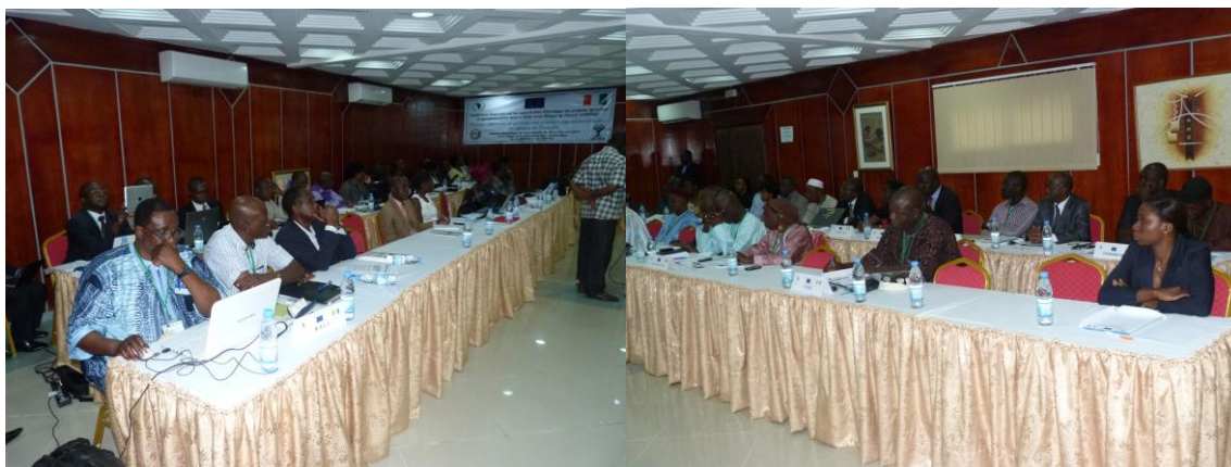
Photos 3 et 4 : Vue d'ensemble des participants lors des présentations