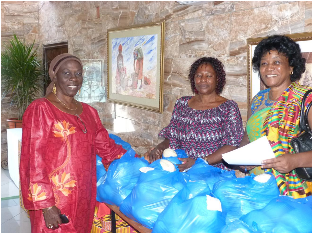
Photo 1 : Deux opératrices ivoiriennes (posant avec une opératrice sénégalaise) livrant des commandes d' « attiéké » (vue partielle) aux participants à la CORPAO 2014

Les travaux de la conférence se sont déroulés en plénière et repartis en cinq (5) sessions.